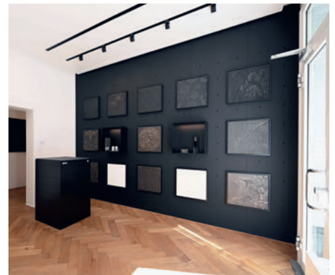
Showroom, Re-Opening 2023

Showroom 58 by Strasserthun Bäckerstrasse 58 8004 Zürich STRASSERTHUN.CH