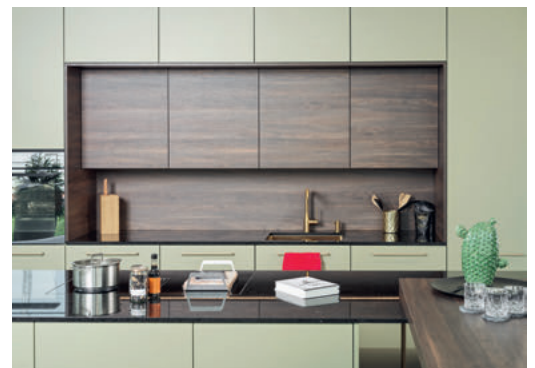
Showroom Veriset AG, Root/LU

Veriset AG Oberfeld 8 6037 Root VERISET.CH