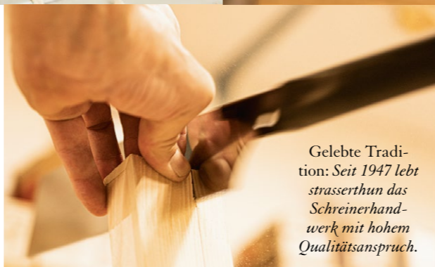
Gelebte Tradition: Seit 1947 lebt strasserthun das Schreinerhand- werk mit hohem Qualitätsanspruch.

Das Team von STRASSERTHUN trägt die Handwerkskunst im Herzen und geht mit Freude und Innovationskraft in die Zukunft.